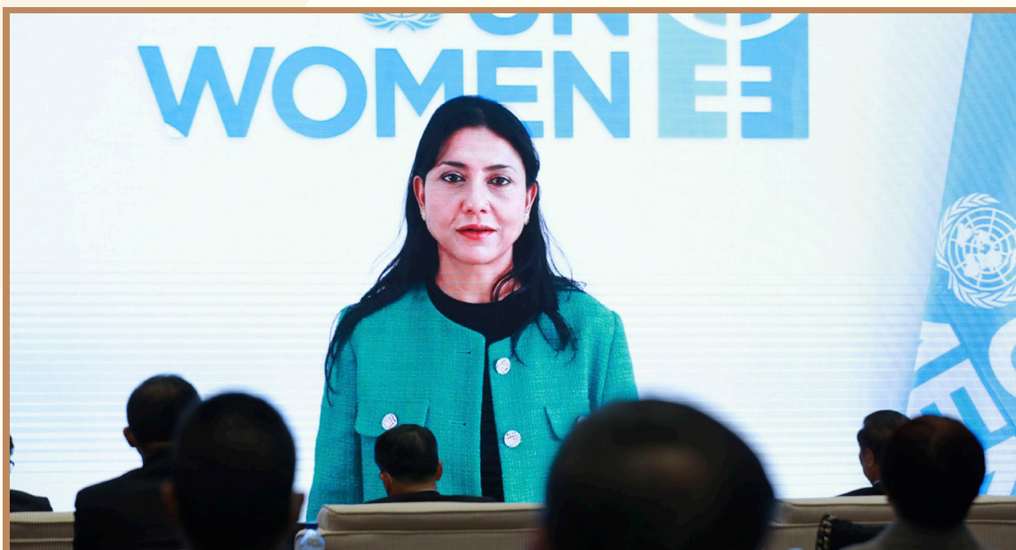
联合国妇女署驻华代表安思齐 以视频方式出席“全球人才流动与发展”分论坛并作主旨发言

联合国妇女署驻华代表安思齐在视频发言中表示，在讨论全球人才发展时，需要考虑赋权妇女和女童，充分发挥她们的才能，这对社会经济可持续发展和人口结构转型而言非常关键。对于男性和女性来说，技能发展的起跑线并不是一样的，需要女性优先的方案来发展她们的才能。为了实现这一点，除了解决结构性障碍，还应通过技能培训和提升，为妇女提供更多的激励和支持，以充分发挥女性的知识和经验。