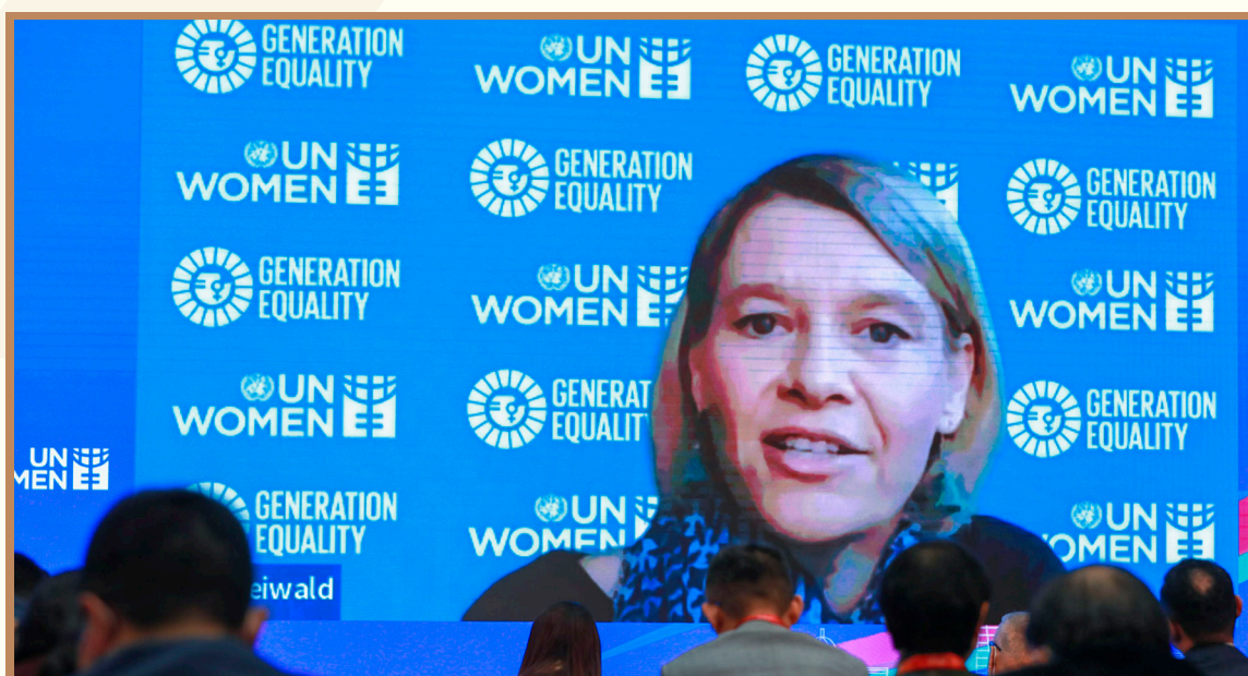
联合国妇女署妇女经济赋权负责人凯佳·弗雷瓦尔德 线上出席“全球人才流动与发展”分论坛并参与成果发布

联合国妇女署妇女经济赋权负责人凯佳·弗雷瓦尔德通过视频对报告进行评议。她表示，为了能在充分挖掘女性劳动力的巨大潜力方面提供更多的支撑和建议，可以在未来的系列报告，包括“人才竞争力评估指数”中引入性别视角，进而对人才竞争力实施更全面的衡量，推动性别敏感的人才引进和人才保留政策。她还建议，未来还可以关注分性别的数据收集和分析，以及针对女性人才流动的趋势分析。这将有助于为性别敏感性的人才流动政策提出建议，包括考虑到男性和女性生命历程的区别，以及在移民政策中对“技能”的定义具备更强的性别敏感度。