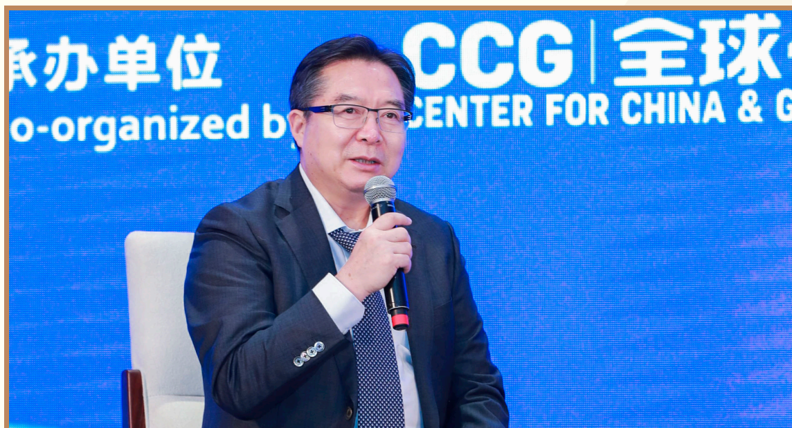
国家督学、清华大学基础教育研究所所长王殿军 在上海出席“全球人才流动与发展”分论坛并参与成果发布

国家督学、清华大学基础教育研究所所长王殿军表示，《全球人才流动趋势与发展报告》中的两个数据——人才数量和人才质量，给他留下了深刻的印象。一方面，中国人才数量位居全球第一，是对中国人才培养的肯定。另一方面，中国人才质量却依然任重而道远。《报告》中对于人才流动现状的分析值得我们反思：一是本土教育的国际化有待提高；二是中学和大学在全球吸引力不够高。王殿军指出《报告》不仅给他启发，而且在某种意义上也给未来教育改革指明了方向——瞄准国际最先进水平提高教育质量。