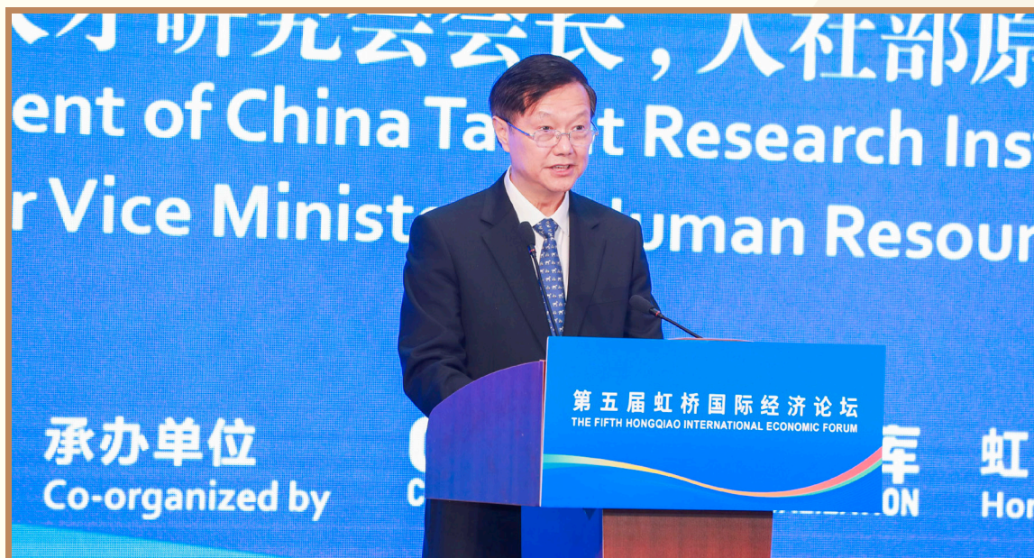
中国人才研究会会长、人社部原副部长何宪 在上海出席“全球人才流动与发展”分论坛并作主旨发言

中国人才研究会会长、人社部原副部长何宪表示，中国要在新一轮以大数据、人工智能、5G 技术为代表的科技革命中占据优势，尤其需要聚天下英才而用之，着力增强国际人才竞争力，实现人才引领驱动，形成人才国际竞争的比较优势。