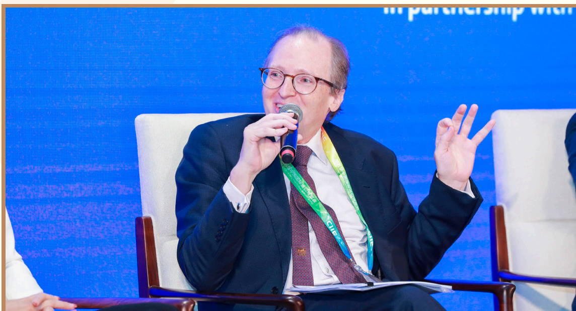
麦肯锡高级合伙人、麦肯锡全球研究院院长华强森 在上海出席“全球人才流动与发展”分论坛并参与互动讨论

麦肯锡高级合伙人、麦肯锡全球研究院院长华强森表示，从个人角度而言，人力资本非常关键。技能对人力资本而言至关重要，可以从变更工作的过程中获取经验。从企业角度来说，真正以人为本的企业能够创造价值和利润，尽管财富表现可能会有些许波动性，但总体而言具有可持续性。对一个企业而言，能够将人和理论结合起来是最为理想的情况。