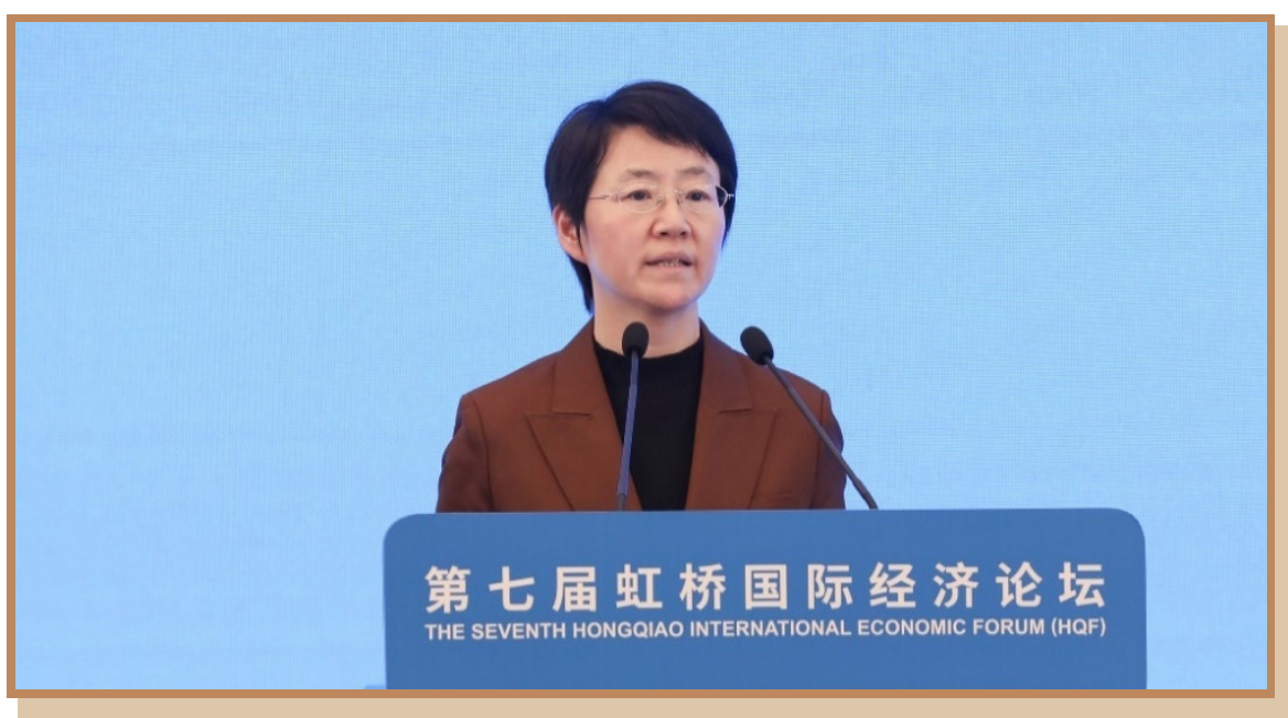
上海市副市长解冬 出席“数字金融助力全球经贸发展”分论坛并致辞

上海市副市长解冬指出，作为“五个中心”建设的重要基石，上海国际贸易中心自 2020 年基本建成后核心功能持续提升。国家政策支持上海创建丝路电商合作先行区，扩大电商开放，推动数字经济合作，同时支持浦东新区改革开放，为上海国际贸易和金融中心的联动发展打下坚实基础。近年来，上海大力推动数字金融发展，强化数字金融创新，加快 AI 在金融领域的应用，并积极支持金融机构先行先试，建立全国首个“数字人民币+数字贸易”孵化基地。希望今后各方为上海的国际金融和贸易中心建设贡献智慧，支持上海建设具有全球影响力的社会主义现代化国际大都市。