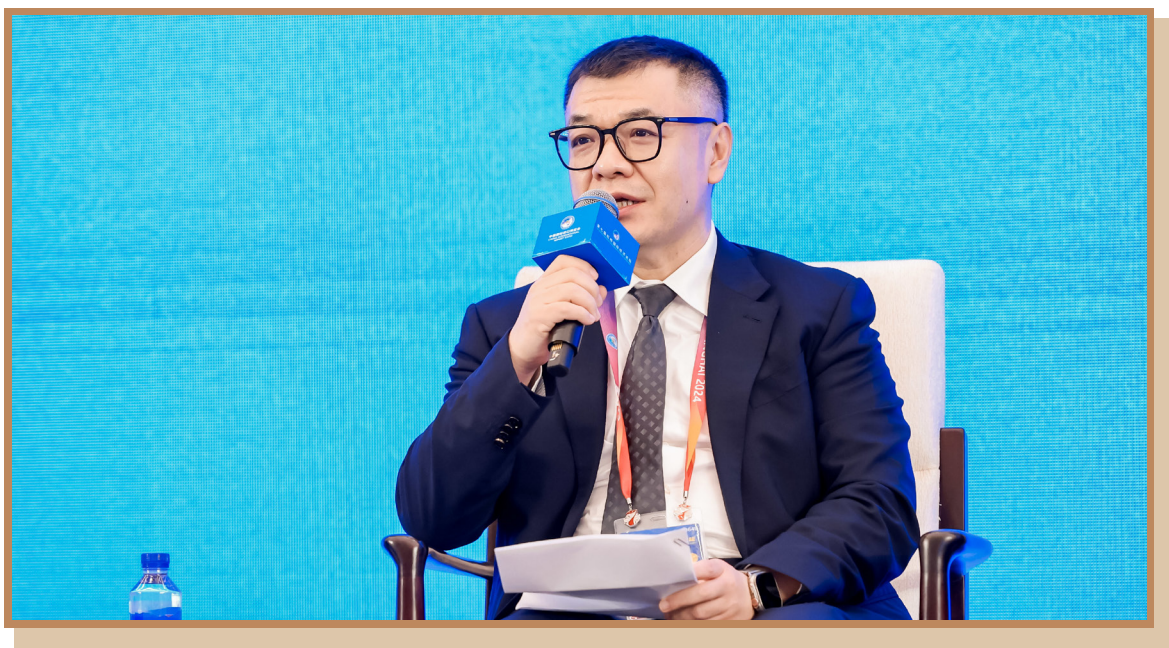
人民银行数字货币研究所副所长狄刚 出席“数字金融助力全球经贸发展”分论坛并参与讨论

人民银行数字货币研究所副所长狄刚表示，数字货币研究所致力于服务实体经济和普惠金融，采用数字金融技术创新解决支付难题。一是建立了央行与商业机构的双层运营体系，目前数字人民币已在 17 个省市试点，支持外国人支付便利性，促进全产业链健康发展。二是强化技术基础，建设央行端和运营机构后端系统，提供数字人民币组件化服务。三是研发区块链智能合约技术，实现信息流和资金流统一，降低履约成本，提高监管效率。四是研发了无网无电支付技术，解决区块链“三高一低”问题，强化标准支撑，持续创新驱动，提升国际标准参与度和话语权。