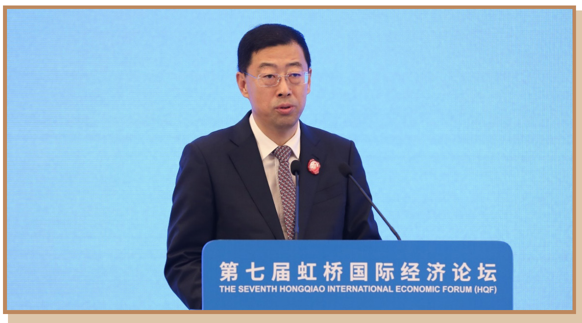
中国银行董事长葛海蛟 出席“数字金融助力全球经贸发展”分论坛并致辞

中国银行董事长葛海蛟表示，数字金融在服务经贸发展方面展现出与产业链融合更加紧密、与中小企业特点更加契合、与贸易新业态发展相向而行的特点。中国银行将继续深入参与数字金融生态建设，助力全球经贸发展。一是共享数字贸易机遇，拓展普惠金融服务，助力中小企业跨境金融。二是共商数字规则，促进业务协同与监管合作。三是构筑风险屏障，提供全方位风险管理方案。四是共建金融基础设施，参与“丝绸之路”建设，提升跨境贸易效率与安全。