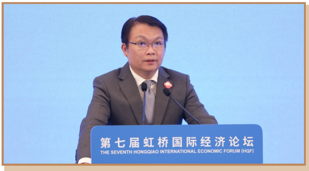
澳门特区政府经济财政司司长李伟农 出席“数字金融助力全球经贸发展”分论坛并作主旨发言

澳门特区政府经济财政司司长李伟农表示，产业数字化不断推进，为国家扩大高水平对外开放带来了新动能，也为各方合作迎来了新的发展机遇。澳门正加快推进“数字澳门元”研发工作，全面落实首份《经济适度多元发展规划》，重点推动综合旅游休闲业，以及中医药大健康、现代金融、高新科技、会展商贸等产业高质量发展的过程中开创及应用更多元的数字技术，促进新业态、新模式发展，提升新质生产力。面对数字化带来的新机遇，澳门将依托作为“中国与葡语国家商贸合作服务平台”的发展定位，继续发挥桥梁和纽带作用，为持续深化经贸、金融等多领域合作提供助力。