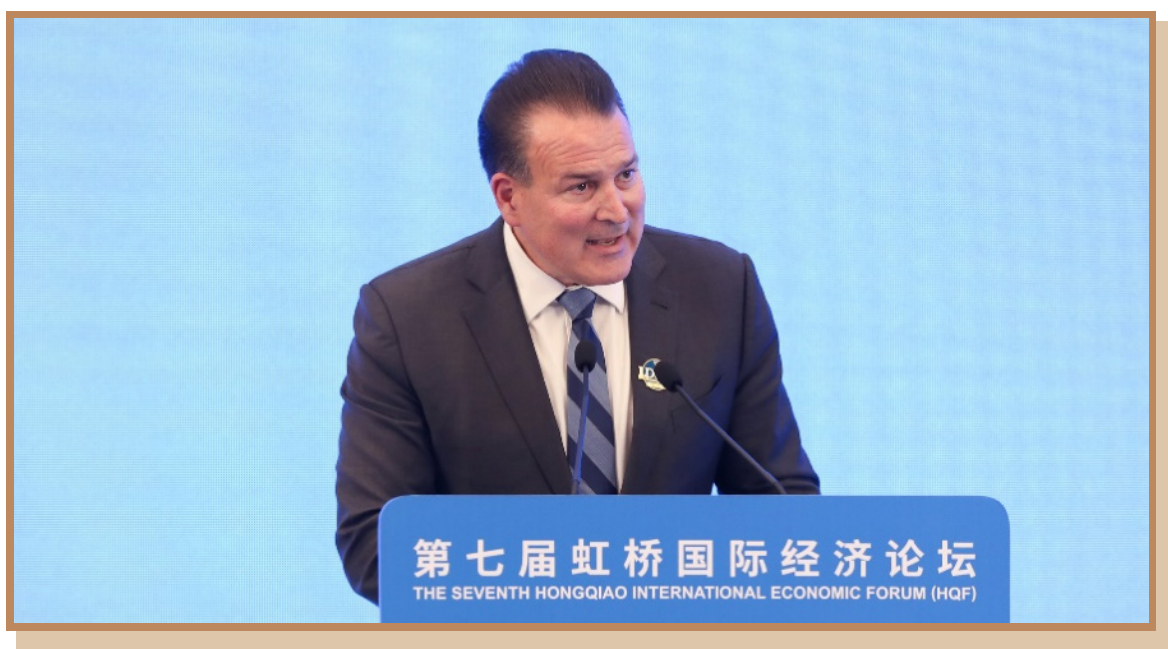
路易达孚集团全球首席执行官高启 出席“数字金融助力全球经贸发展”分论坛并作主旨发言

路易达孚集团全球首席执行官高启表示，大数据分析、区块链等技术已广泛应用于当代农业供应链的各个环节。数字技术为电商发展提供平台和机会，让生产者和消费者直接进行沟通，促进经济发展。先进的数字经济在中国发展战略中占着非常重要的地位，在农业发展、提供金融解决方案、提高透明度等各个方面都发挥着重要作用。区块链技术能够大幅减少全球贸易在流程上的复杂程度，更好追溯产品来源和质量。路易达孚集团愿和中国及各方加深合作，共同应对挑战，抓住机遇，促进数字化转型，创造更具韧性的食品和农业贸易环境。