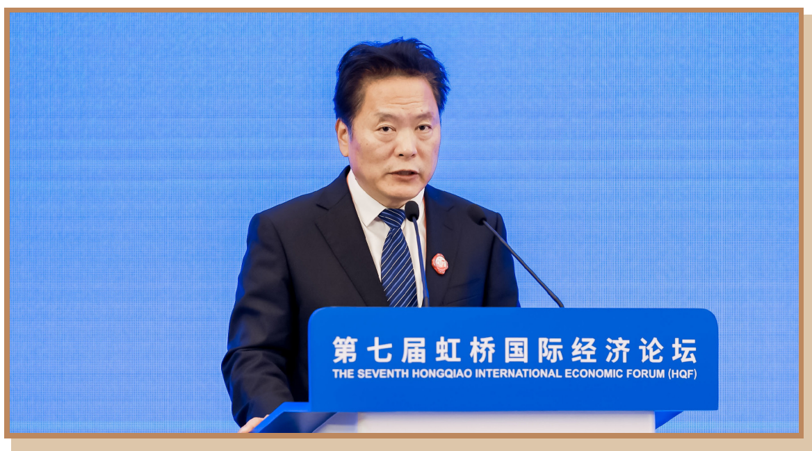
新华社副社长袁炳忠 出席“数字金融助力全球经贸发展”分论坛并致辞

新华社副社长袁炳忠表示，在大数据、区块链、人工智能等数字技术推动下，金融业正在经历一场前所未有的巨大变革。发展数字金融，既需要主管部门政策扶持的“硬举措”，也需要新闻媒体营造积极有利的“软环境”。新华社将充分发挥全球布局、全球采集、全球传播、全球到达的独特优势，为金融业数字化转型加油助力。一是发挥强大的媒体平台优势，营造数字金融发展良好环境。为广大金融企业提供更好的信息服务，为数字经济发展提供强有力的智力支撑。二是发挥专业的服务资源优势，赋能金融业数字化转型。三是发挥高端智库平台优势，推动数字金融行稳致远。