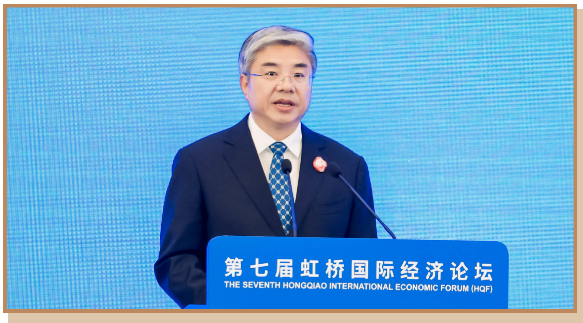
商务部党组成员、部长助理唐文弘 出席“数字金融助力全球经贸发展”分论坛并致辞

商务部党组成员、部长助理唐文弘指出，数字金融有助于提升金融服务效率、推动金融普惠，增强服务实体经济和防范金融风险的能力，助力加快形成新质生产力。近年来，商务部从深化数字领域开放、推进商务金融合作、畅通传导渠道等方面，持续加强与金融领域协同，共同促进数字金融发展，提升金融服务实体经济质效。面向未来，商务部将会同有关部门，从贸易强国和金融强国建设的战略全局来谋划推动商务领域金融工作，协同推进商务和金融高质量发展。