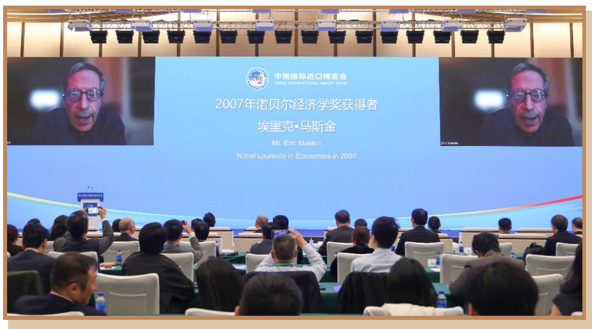
2007 年诺贝尔经济学奖获得者埃里克·马斯金 以视频方式出席“数字金融助力全球经贸发展”分论坛并作主旨发言

2007 年诺贝尔经济学奖获得者埃里克·马斯金表示，区块链是一项变革性的技术，已广泛应用于转账、航运物流等各个领域，有助于实现资源的有效配置，使交易更加安全，而比特币等加密货币则可能干扰政府货币政策的实施效果，也可能被用于非法交易规避政府监管。未来，区块链技术能使交易更加安全友好，但对加密货币应持谨慎态度，政府部门应继续实施逆周期调节的货币政策，由政府创造的货币将继续占主导地位。