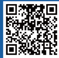
第八届虹桥国际 经济论坛报告等成果集