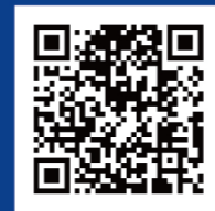
第八届虹桥论坛 分论坛发言选编

地址：中国上海市盈港东路168号 电话：+86 021-39796248 /010-85093631 邮编：200217 邮箱：hongqiao_forum@ciie.org