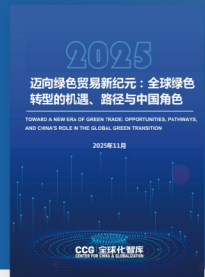
迈向绿色贸易新纪元： 全球绿色转型的机遇、路径与中国角色