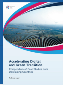
加速数字和绿色转型—— 发展中国家案例集