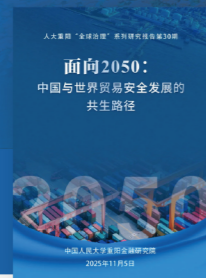
面向2050： 中国与世界贸易安全发展的 共生路径