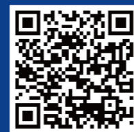
虹桥论坛合作伙伴