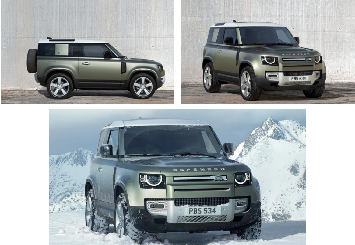
图 12、13、14：路虎卫士宣传图

代车型。路虎卫士可沉稳应对极端地形，带领乘驾人从都市森林来到变化多端的沙地和冰雪环境，一路披荆斩棘，所向披靡。