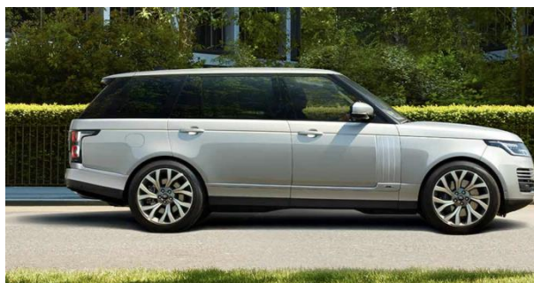
图 15、16、17：路虎揽胜宣传图