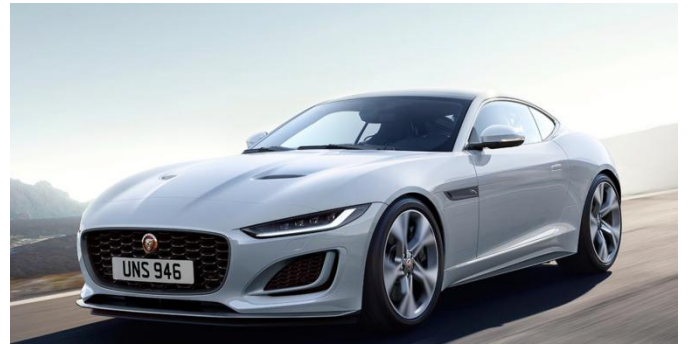
图 21、22、23：捷豹 F-TYPE 宣传图