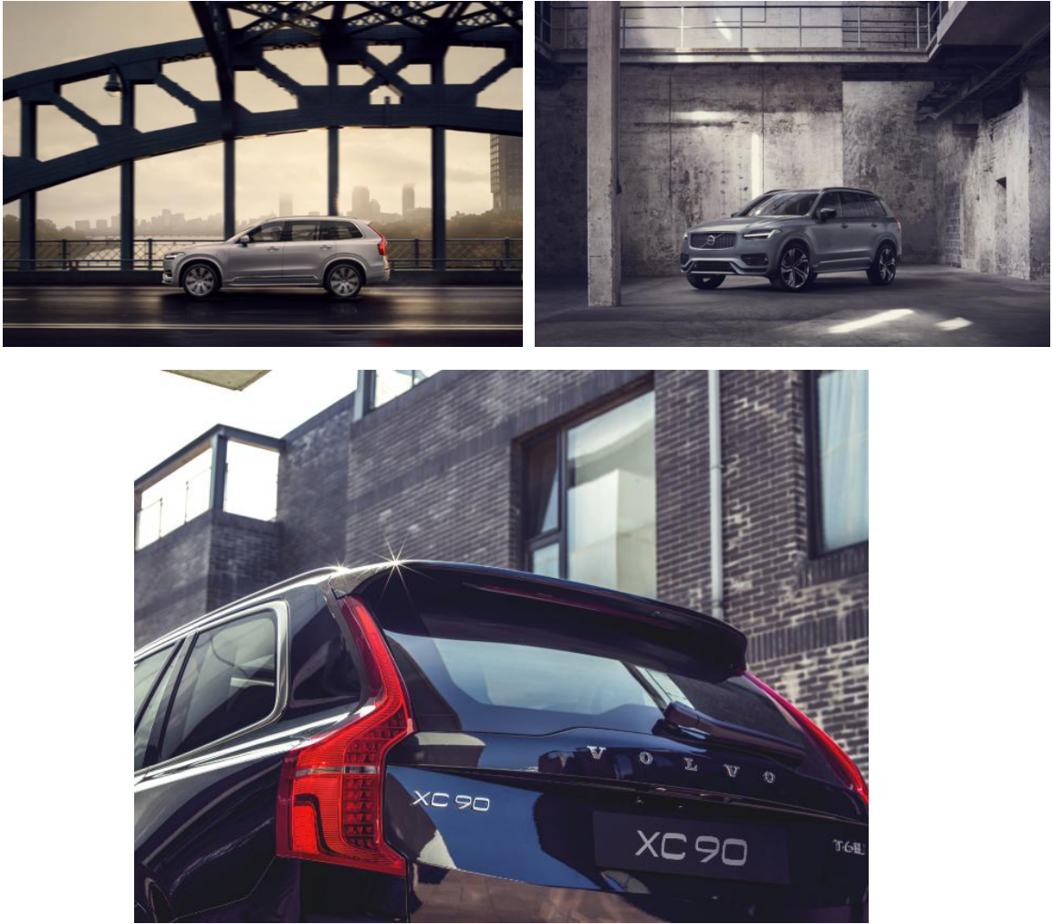
图 35、36、37：沃尔沃 XC90 宣传图