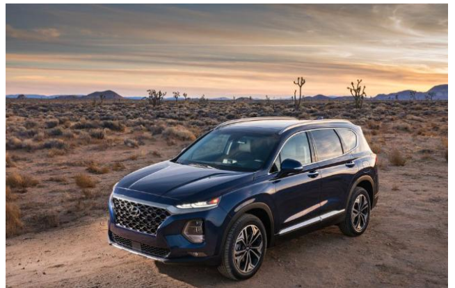
图 1、2、3: Palisade 宣传图