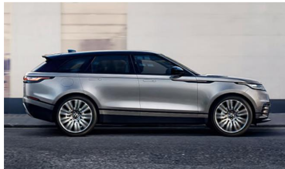
图 18、19、20：路虎全新揽胜星脉宣传图