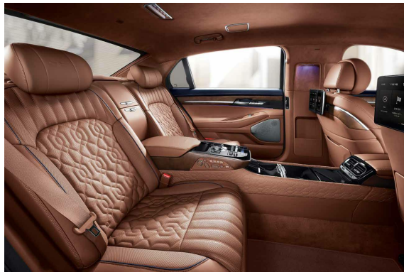
图 9、10、11：G90 行政版宣传图