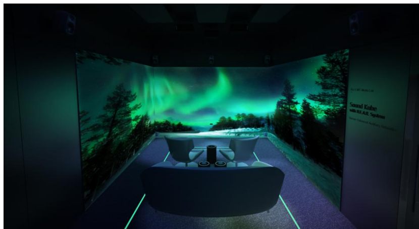
图 4: H.E.A.R system 宣传图