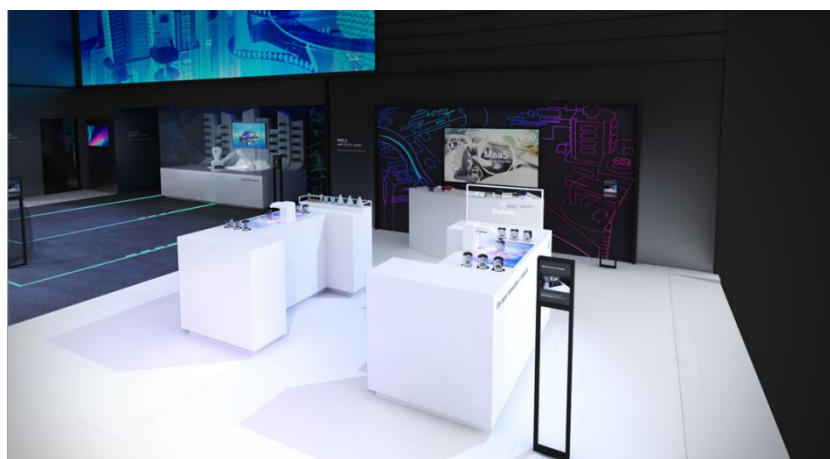
图 5: O.D.O.R system 宣传图

此款搭载在车内的气味调节系统为中国首发。在车辆行驶过程中，自动识别车内难闻气味，并将其净化，从而提供最舒适的车内环境。