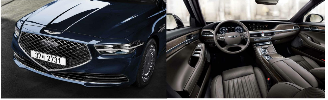
图 7、8：G90 宣传图