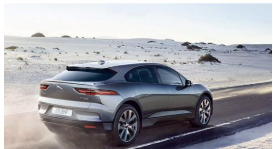
图 24、25、26：捷豹 I-PACE 宣传图