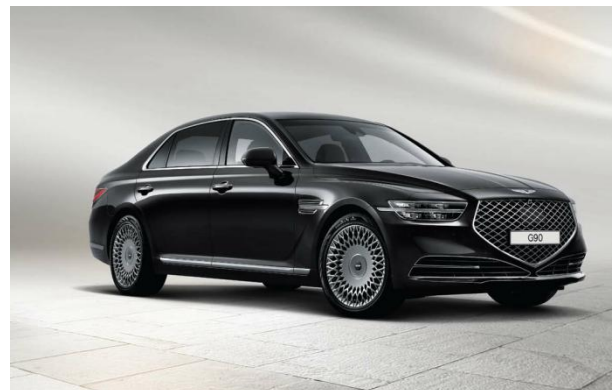
图 6：G90 宣传图

G90 和 G90 行政版为品牌旗舰豪华车型，采用捷尼赛思动感优雅的设计。曾获 2019 年/2020 年美国公路安全保险协会顶级安全选择奖。G90 行政版将在第三届进博会中国首秀。