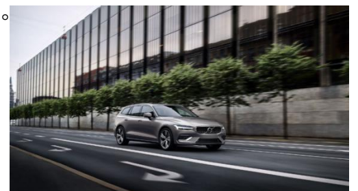
图 27~30: 沃尔沃 V60 宣传图