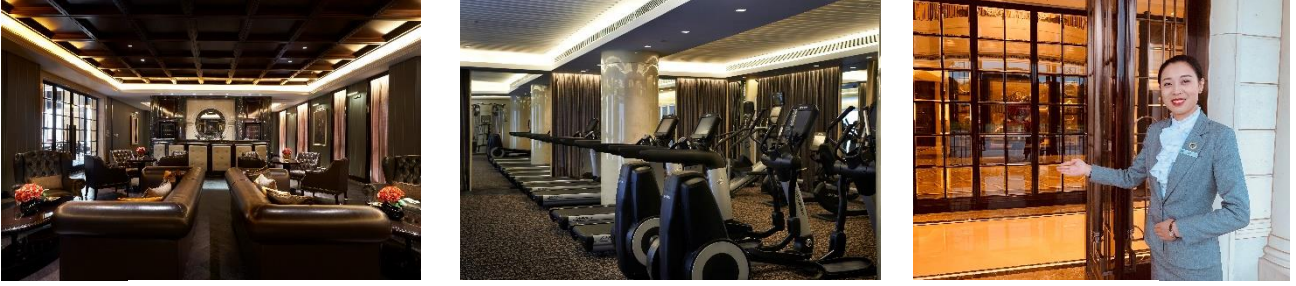
图 1、2、3: 社区俱乐部全方位管理顾问服务宣传示意图