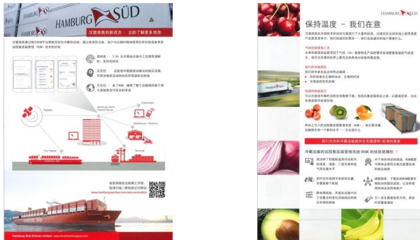
图 16: 远程集装箱管理(RCM)技术宣传示意图

注册简单，客户可以通过任何在线设备随时使用，7×24 小时全天候提供清晰、实时的箱内工况综览，通过数据驱动做出相关决策，可灵活改变货物走向。