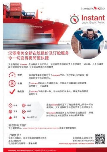
图 17: Instant(在线报价及订舱服务) 宣传示意图

通过汉堡南美的网站登入 Instant 平台，可随时获得报价及订舱确认，价格不受其他因素或时间影响，下单后舱位即被锁定。