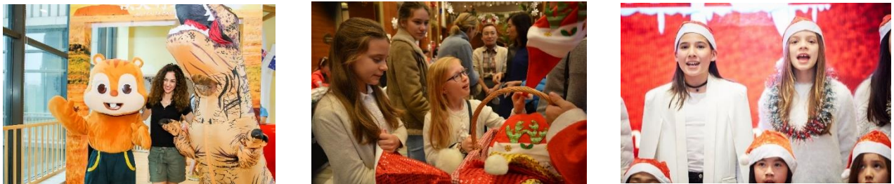
图 7、8、9: 宣传示意图