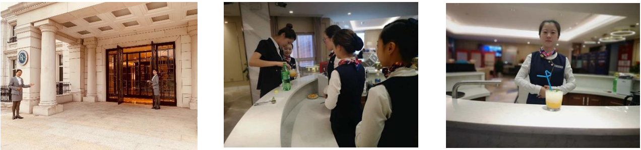
图 4、5、6: 售楼处全权管理宣传示意图

包括定制及提供售楼处的高端服务标准, 人员招聘、培训和派驻, 俱乐部主题活动支持, 保洁标准等。