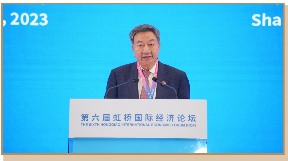
全球服务贸易联盟理事长姜增伟 在上海出席“探寻国际数字治理之道 同创数字产业发展之机”分论坛 暨数字贸易创新高端对话并致辞

全球服务贸易联盟理事长姜增伟表示，当前全球数字贸易的发展规模和内涵持续扩大。数字技术的创新发展催生了服务贸易的新模式、新业态、新亮点，同时也带动了农业、制造业和传统服务业产业链、供应链、价值链加速整合优化。各方需要加强跨境数字基础设施合作，在数据流动、市场准入、税收、知识产权、个人隐私数据保护等相关标准和规则的制定方面，深化交流，增进共识和信任，共同营造开放、合作、包容、安全的数字贸易发展环境。