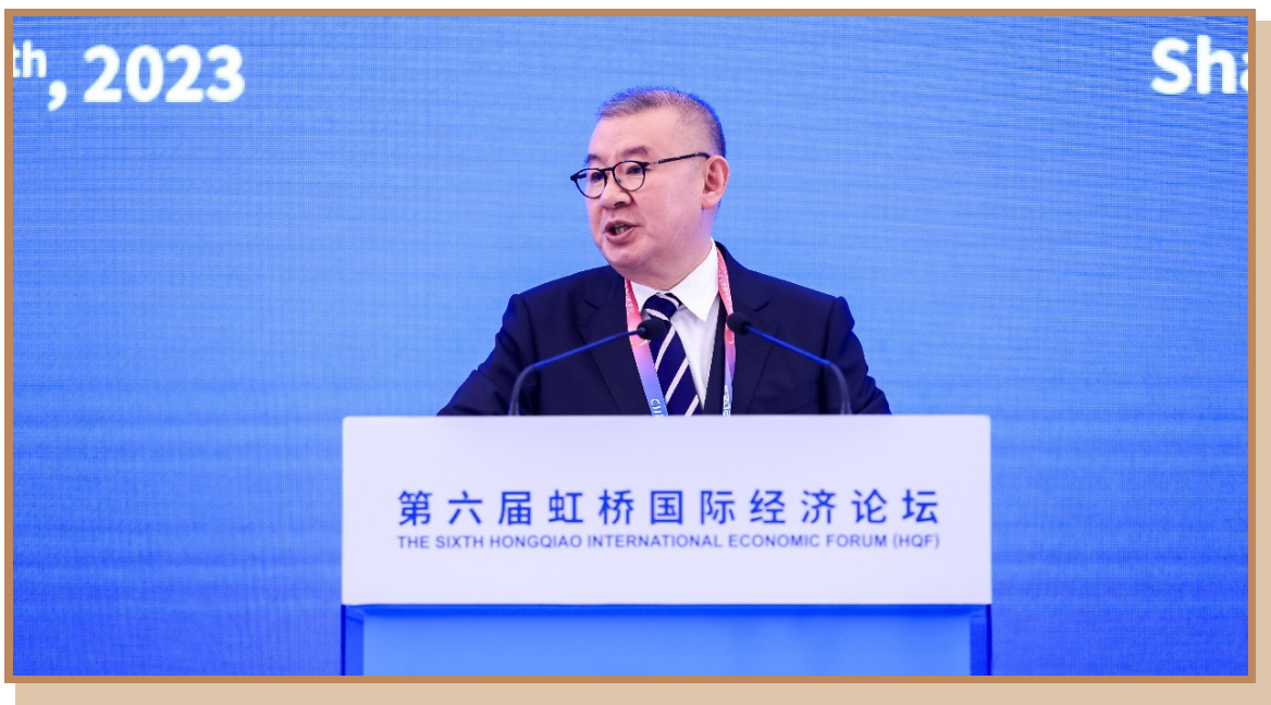
中国科学院大学知识产权学院院长马一德 在上海出席“探寻国际数字治理之道 同创数字产业发展之机”分论坛 暨数字贸易创新高端对话并参与成果发布