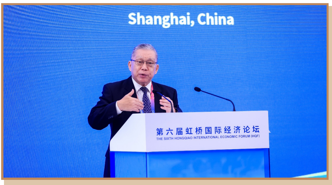
新加坡国立大学李光耀公共政策学院亚洲竞争力研究所所长、实践教授张保罗 在上海出席“探寻国际数字治理之道 同创数字产业发展之机”分论坛 暨数字贸易创新高端对话并发表主旨演讲

新加坡国立大学李光耀公共政策学院亚洲竞争力研究所所长、实践教授张保罗介绍了新加坡和东盟国家在数字交付贸易领域的最新趋势。跨境数据流动对数字交付贸易至关重要，例如云计算、数字营销、金融服务、全球供应链管理等数字服务跨境贸易十分依靠跨境数据流动。目前东盟国家的跨境数据管理有三个模式：开放模式、有条件开放模式、本地化模式。由于各国管理方式不太一致，数据缺乏互操作性。此外，他强调了通过 RCEP、CPTPP、DEPA 等贸易协定促进数字交付贸易的重要性。