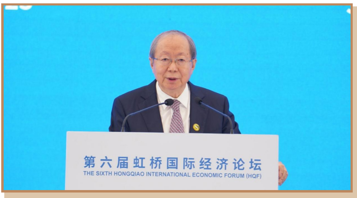
中国经济体制改革研究会会长、国家发展和改革委员会原副主任彭森 在上海出席“探寻国际数字治理之道 同创数字产业发展之机”分论坛 暨数字贸易创新高端对话并致辞

中国经济体制改革研究会会长、国家发展和改革委员会原副主任彭森表示，数字经济的发展面临两个深层次的问题。其一，数字经济发展趋势壮大所产生的宏观层面的体制机制创新，以及治理规则的建立问题。其二，在技术层面上，数字经济的基础构建即数据要素市场的建设问题，这两个层面问题既有交叉又有区别。解决以上问题要正确处理好有效市场和有为政府的关系，坚决维护有效市场，正确发挥有为政府的作用，积极参与国际数字经济与数字贸易规则的制定。