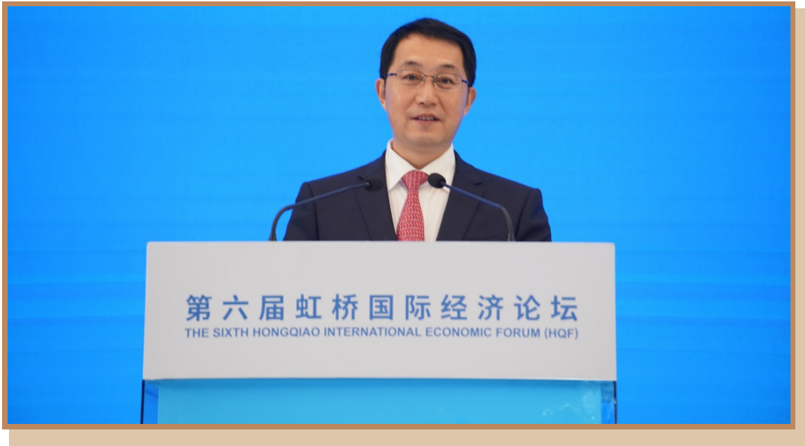
苏州市市长吴庆文 在上海出席“探寻国际数字治理之道 同创数字产业发展之机”分论坛 暨数字贸易创新高端对话并致辞

苏州市市长吴庆文表示，近年来苏州持续推进高水平对外开放，积极开展服务贸易创新发展三轮试点，服务贸易规模稳步扩大，结构持续改善。2023年7月初，习近平主席亲临苏州视察，第一站就到了中新合作建设的苏州工业园区。习近平主席强调要继续扩大国际合作，把苏州工业园区打造成为开放创新的世界一流高科技园区。苏州坚持将中新合作作为发展的长期战略，充分发挥苏州工业园区探路者、先行者的作用，推进中新合作向全领域、全方位拓展。