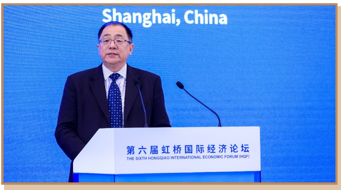
高通公司中国区董事长孟樸 在上海出席“探寻国际数字治理之道 同创数字产业发展之机”分论坛 暨数字贸易创新高端对话并发表主旨演讲

高通公司中国区董事长孟樸认为，5G 和人工智能等数字技术推动数字贸易发展和创新。5G 的超高速传输能力极大地提升了信息的流动效率，使跨地域协作更加高效，同时，5G 连接也为智能交通、智慧城市等领域的创新开拓了更多的可能性。如果说 5G 为数字贸易创新发展提供了连接的基础，AI 则为数字贸易注入了更多的智慧，带来了更为深入的数据洞察力，更高的智能化和自动化经营水平，以及更加个性化的客户支持和互动，推动数字贸易走向更智能、更具竞争力的未来。