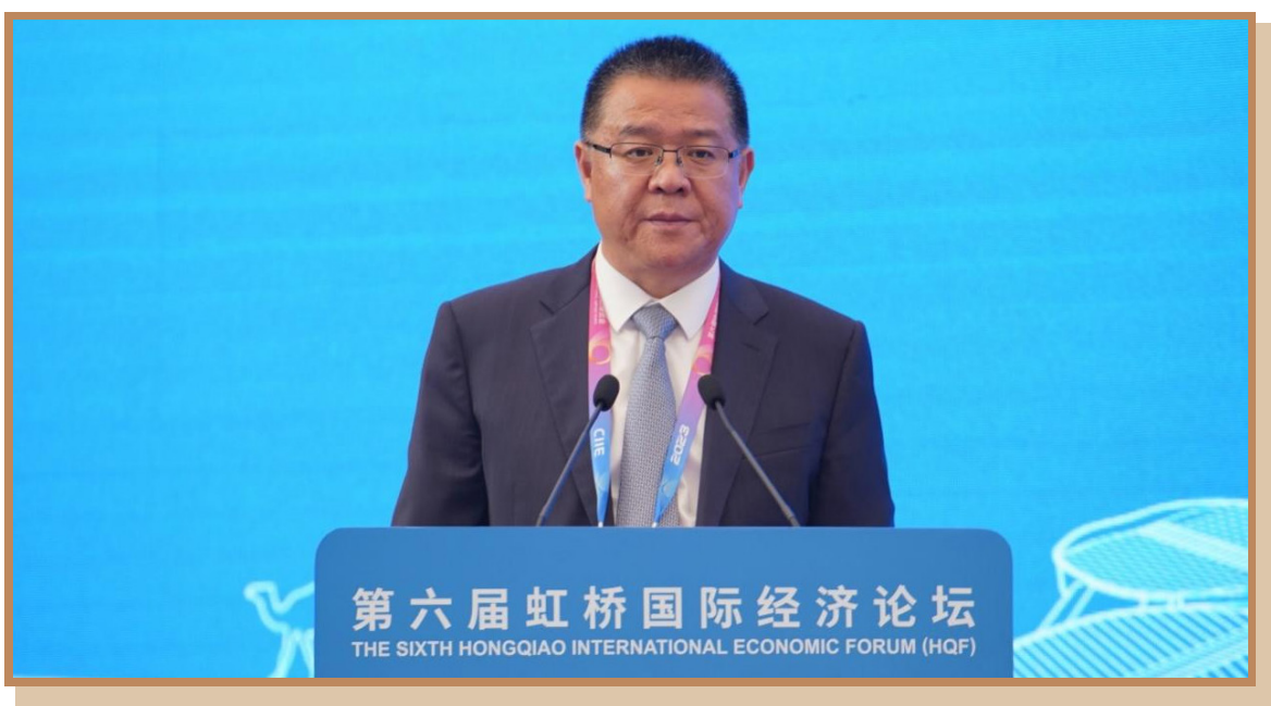
苏州市副市长唐晓东 在上海出席“探寻国际数字治理之道 同创数字产业发展之机”分论坛 暨数字贸易创新高端对话并主持致辞、主旨演讲环节