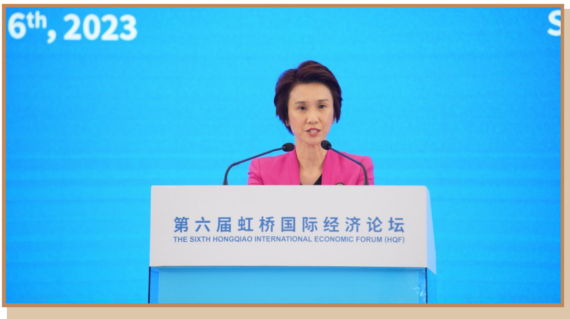
新加坡贸工部兼文化、社区及青年部政务部长刘燕玲 在上海出席“探寻国际数字治理之道 同创数字产业发展之机”分论坛 暨数字贸易创新高端对话并致辞

新加坡贸工部兼文化、社区及青年部政务部长刘燕玲表示，新加坡和中国都意识到，提升数码化领域的的能力对于支持下一阶段的增长是至关重要的。例如新加坡有“Smart Nation”（智慧国）的计划，而中国也制定了一项全面的“数字中国”计划，两者非常相似。各国应致力于提升各自数字生态系统，齐心协力优化跨国和跨境整体数字生态大环境，加强数字经济交流。新中两国将加强在数字经济法规和政策方面的经验交流，探讨进一步在数字贸易、跨境数据流动和数字身份等方面的合作。