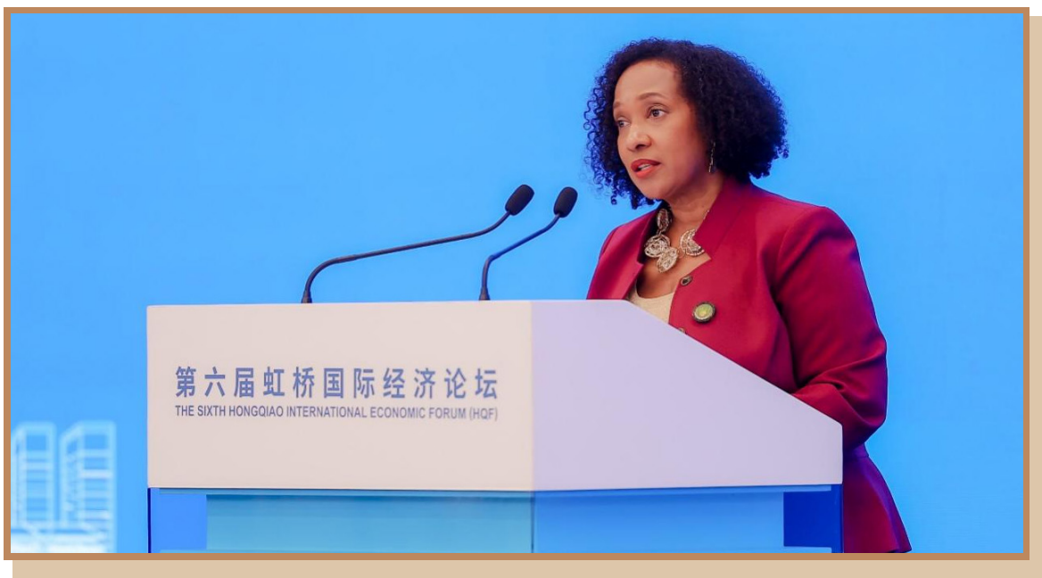
联合国国际贸易中心执行主任帕梅拉·库克 - 汉密尔顿 在上海出席“探寻国际数字治理之道 同创数字产业发展之机”分论坛 暨全球数字产业高峰对接会并致辞

联合国国际贸易中心执行主任帕梅拉·库克 - 汉密尔顿表示，联合国国际贸易中心持续关注中小企业的业务，帮助中小企业实现更多、更便利的国际贸易。数字互联对于中小企业来说有非常重要的意义。中小企业应积极布局线上，并且尽可能去使用最新的技术。国际贸易中心将致力于连接各个相关方，提供资源和培训，促进电商发展。在全球数字产业快速发展的背景下，各国应重视中小企业对于数字化发展的需求，为其数字化转型制定支持政策、营造有利的发展环境。