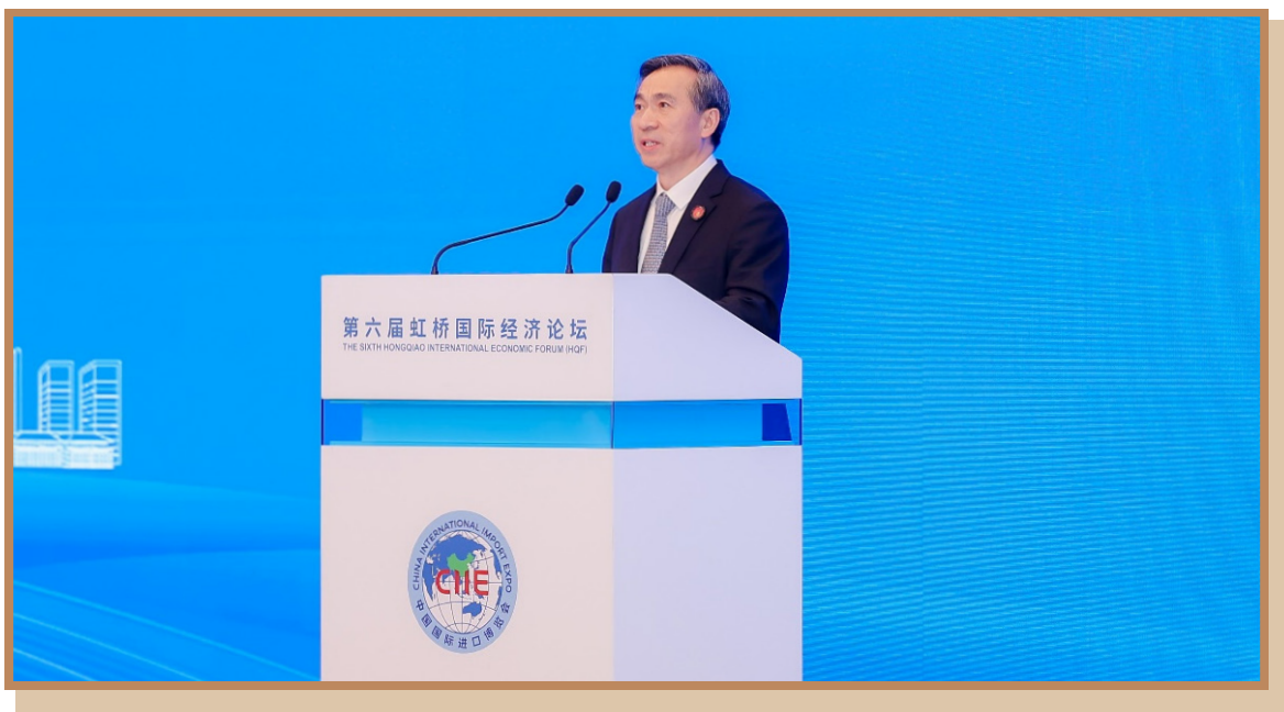
中国国际贸易促进委员会会长任鸿斌 在上海出席“探寻国际数字治理之道 同创数字产业发展之机”分论坛 暨全球数字产业高峰对接会并致辞

中国国际贸易促进委员会会长任鸿斌就推动数字产业发展提出三点建议：一是推进企业数字化转型升级。希望广大企业强化数字化思维，加强加快研发设计、生产加工、经营管理等业务数字化转型，提升整体运行效率和产业链上下游协同效率。二是加强数字经济国际合作。近年来中国大力推进数字丝绸之路建设，加强与欧盟、东盟的数字经济合作伙伴关系，推进与非洲国家在区块链、人工智能等领域合作。三是积极参与全球数字治理。中国贸促会组织中国工商界依托 APEC、G20 等多边机制和国际商会等重要平台，聚焦数字化转型等议题提出了一系列的倡议和主张。