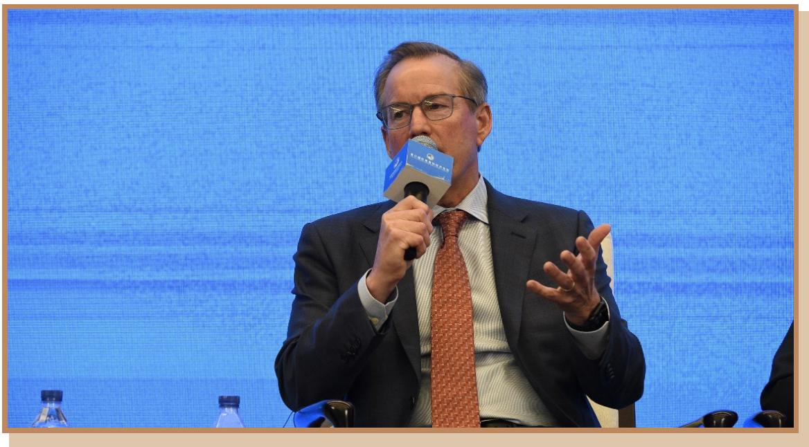
美利肯集团公司总裁兼首席执行官哈尔西·库克 在上海出席“探寻国际数字治理之道 同创数字产业发展之机”分论坛 暨全球数字产业高峰对接会并参与讨论

美利肯集团公司总裁兼首席执行官哈尔西·库克认为，企业需要保持灵敏、保持变革。美利肯目前已通过 AI 赋能产线，实现定制化的生产，打造定制化的解决方案，在运营方面也有很多工业 4.0 的赋能，比如使用自动化机器人实现材料管理、原材料管理等。净零排放是挑战也是机遇。他主张通过数字化驱动创新为子孙后代打造更可持续的未来。