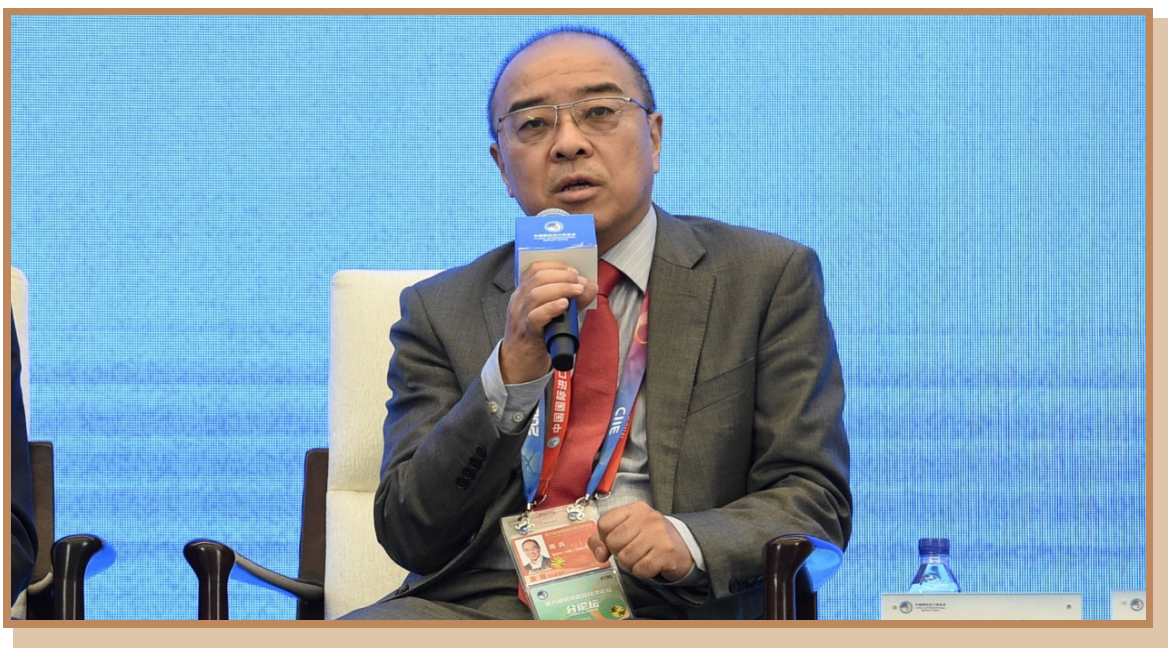
英特尔公司副总裁、中国区公司事务总经理周兵 在上海出席“探寻国际数字治理之道 同创数字产业发展之机”分论坛 暨全球数字产业高峰对接会并参与讨论

英特尔公司副总裁、中国区公司事务总经理周兵认为，在蓬勃发展的数字经济背后蕴含着巨大的技术经济驱动，我们称之为“芯经济”，半导体在整个数字经济的发展中起着底层的基础作用。英特尔坚守以半导体为基础，通过五大技术力量驱动，同各行各业的企业相配合，共同推动数字经济整体的发展。关于数字化转型的挑战，他认为主要有三点，一是怎样让算力跟得上数字化转型的需求，二是怎么满足不同类型的需求，三是如何使数字经济本身是绿色的、可持续的。