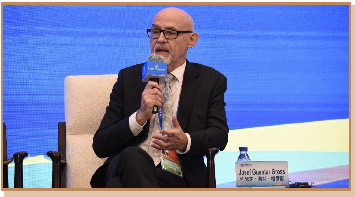
毕威泰克董事长约瑟夫·君特·格罗斯 在上海出席“探寻国际数字治理之道 同创数字产业发展之机”分论坛 暨全球数字产业高峰对接会并参与讨论

毕威泰克董事长约瑟夫·君特·格罗斯表示，对于一些国家，目前近 12% 的 GDP 用于医疗护理，这个数字还在逐年增加。人口老龄化给医疗系统、老年护理系统带来很大的压力，根据卫生组织的研究结果，到 2030 年全球将缺乏 9 亿护士。解决方案在于数字化，自动化护理将更加高效，研究表明 20%–40% 的护理可以实现自动化。