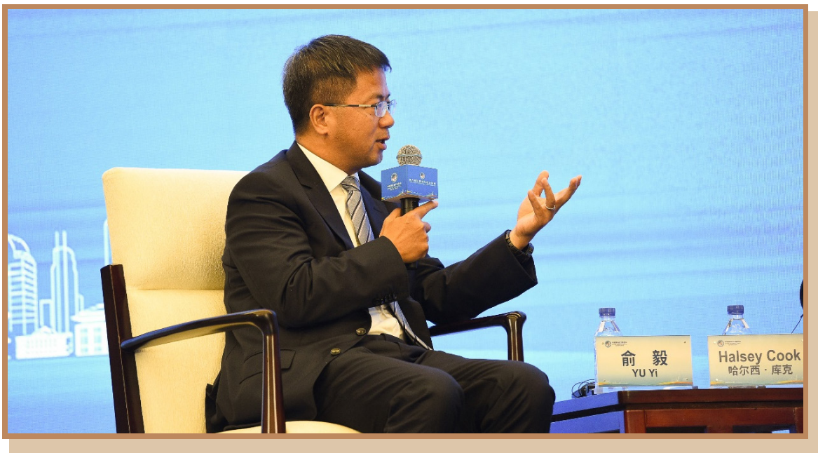
埃森哲全球副总裁俞毅

在上海出席“探寻国际数字治理之道 同创数字产业发展之机”分论坛 暨全球数字产业高峰对接会并主持讨论环节