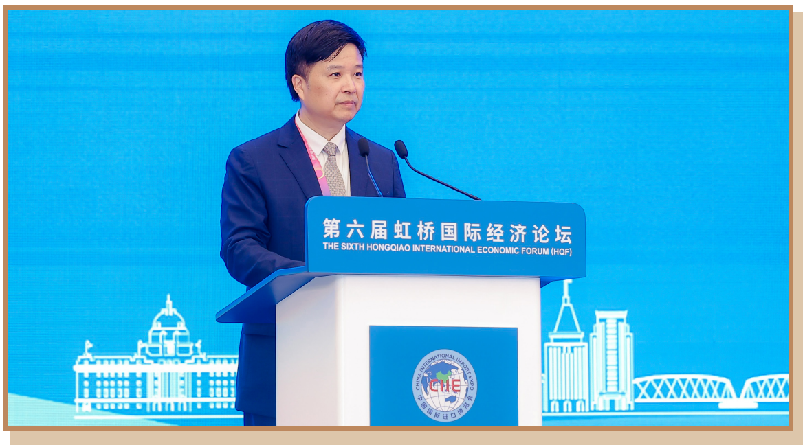
浙江省商务厅厅长韩杰 在上海出席“探寻国际数字治理之道 同创数字产业发展之机”分论坛 暨全球数字产业高峰对接会并主持致辞环节