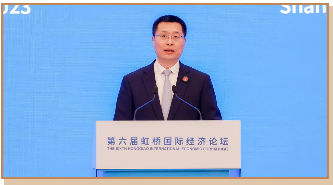
浙江省副省长卢山 在上海出席“探寻国际数字治理之道 同创数字产业发展之机”分论坛 暨全球数字产业高峰对接会并致辞

浙江省副省长卢山指出，浙江省将“数字经济创新提质”作为一号发展工程，强力推动数字经济高质量发展，并向与会嘉宾分享了以碧迪、梦娜、米哈游等公司为代表的众多企业在浙江创业、创新、勇攀高峰的生动案例。向数字化、智能化、绿色化转型是推动企业跨越式发展的必经之路。长期以来，浙江把培育壮大数字企业，激发主体创新活力，加强数字基础设施建设作为数字经济发展的基础支撑。浙江将充分利用良好的数字发展环境，持续助力各类企业拥抱数字、创新发展。