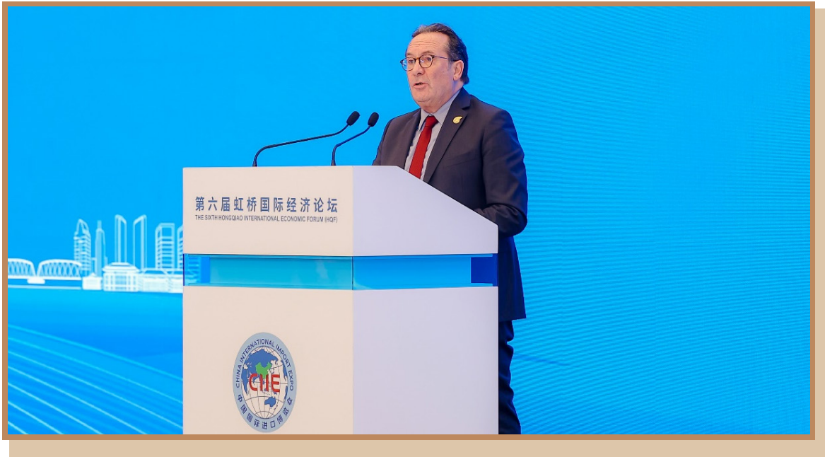
法国伊夫林省（法兰西岛大区）省主席、法语国家商务联盟代表皮埃尔·贝迪斯 在上海出席“探寻国际数字治理之道 同创数字产业发展之机”分论坛 暨全球数字产业高峰对接会并致辞

法国伊夫林省（法兰西岛大区）省主席、法语国家商务联盟代表皮埃尔·贝迪斯介绍了伊夫林省的历史和产业情况。他表示，数字化工业是工业界每天都在致力发展的领域，除了关注数字技术、数字经济，以及当今社会人工智能发展的伦理问题，我们还应牢记数字化的快速发展必须要惠及人民。他认为数字发展必须惠及全球，并分享了法国伊夫林省将数字技术与教育和应对人口老龄化相结合的做法和经验。