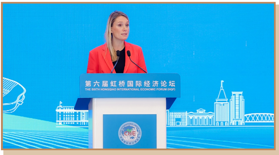
联合国国际贸易中心亚太事务总监希尔维·贝唐·柯欣 在上海出席“探寻国际数字治理之道 同创数字产业发展之机”分论坛 暨全球数字产业高峰对接会并发布报告：《“一带一路”发展中国家对华出口潜力》