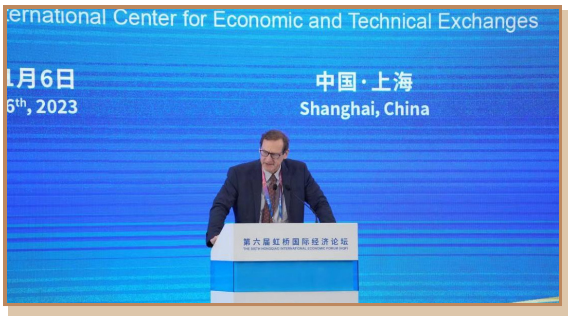
联合国贸发会议全球化和发展战略司司长柯睿智 在上海出席“投资中国年”自贸试验区专场投资促进活动并发布报告： 《中国自贸试验区在促进制度创新、产业转型和南南合作中的作用》