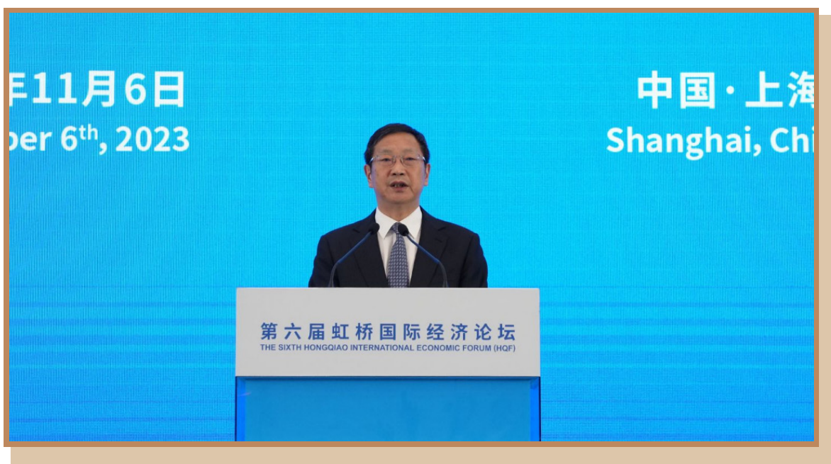
上海市委常委、浦东新区区委书记、上海自贸试验区管委会主任朱芝松 在上海出席“投资中国年”自贸试验区专场投资促进活动并致辞

上海市委常委、浦东新区区委书记、上海自贸试验区管委会主任朱芝松指出，建设自由贸易试验区是中国在新时代全面深化改革，扩大开放的重要战略举措。上海自贸试验区作为全国首个自贸试验区，十年来坚持以制度创新为核心，对标最高标准。三个作用日益凸显：一是高水平改革开放开路先锋，二是高质量发展动力引擎，三是高效能治理示范样板。未来，上海自贸试验区将提升制度型开放引领力、产业体系现代化水平、聚集辐射能级。