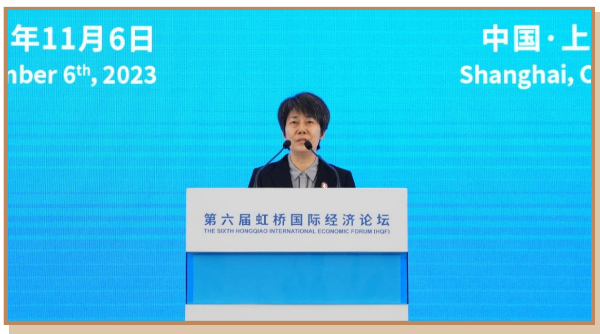
商务部副部长郭婷婷 在上海出席“投资中国年”自贸试验区专场投资促进活动并致辞

商务部副部长郭婷婷指出，建设自贸试验区是中国在新时代推进改革开放的重要战略举措。十年来，自贸试验区从上海启航，逐步形成了覆盖东西南北中，统筹沿海、内陆、沿边的高水平改革开放创新格局，推出一大批基础性、开创性改革开放举措，形成许多标志性、引领性制度创新成果，有效发挥了改革开放综合试验平台作用。中国在新起点上推进高水平对外开放，自贸试验区是重要平台。诚挚欢迎各国投资者来自贸试验区、来中国投资兴业。