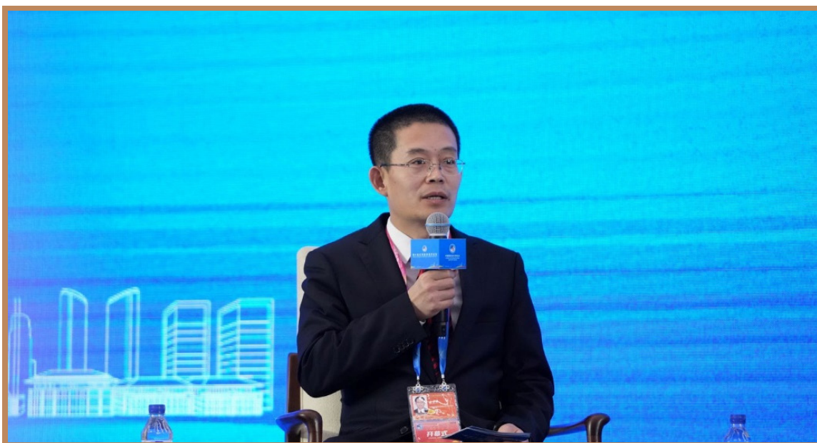
商务部国际贸易经济合作研究院副院长崔卫杰 在上海出席“投资中国年”自贸试验区专场投资促进活动并主持主题对话 1