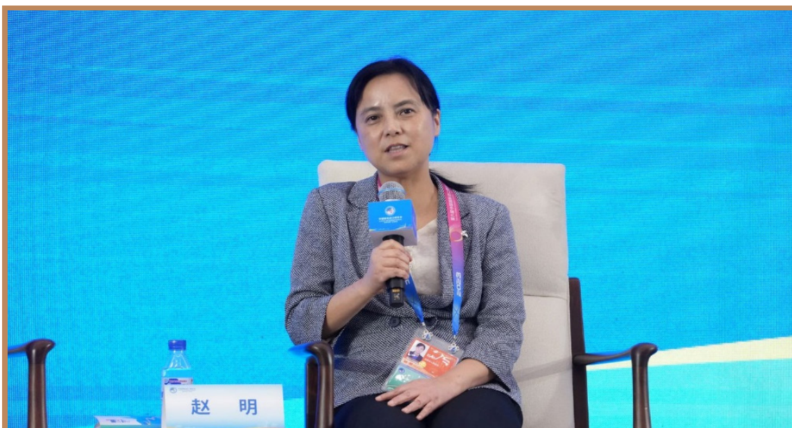
合肥市副市长赵明