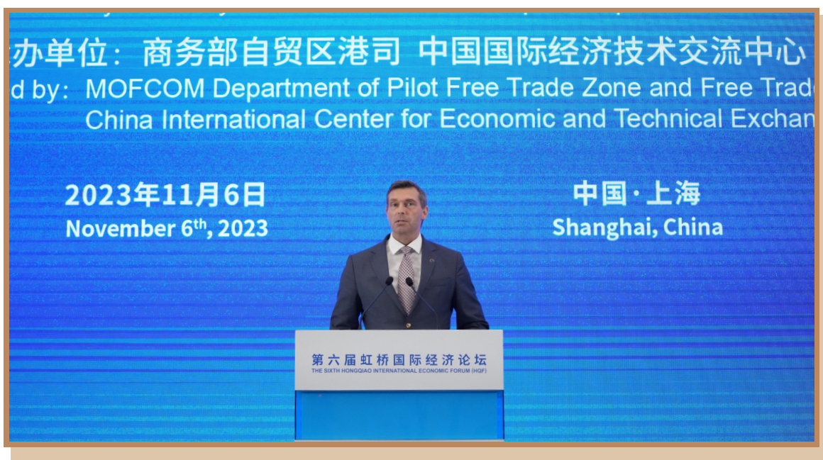
科思创集团首席执行官施乐文 在上海出席“投资中国年”自贸试验区专场投资促进活动并进行主旨发言

科思创集团首席执行官施乐文表示，科思创是全球领先的高品质聚合物材料供应商，致力于开创循环经济。中国的“双碳”目标与科思创 2035 年实现气候中和的愿景不谋而合。中国是科思创的最大市场之一，科思创的发展历程与上海自贸试验区密切相关。科思创提升了上海地区总部地位，使其涵盖投资、创新等重要职能，积极参与浦东的大企业开放创新中心计划，成为上海首个跨国公司全球业务单元总部。本届进博会期间，科思创携手上海本土开发商，推进绿色建筑解决方案应用落地。