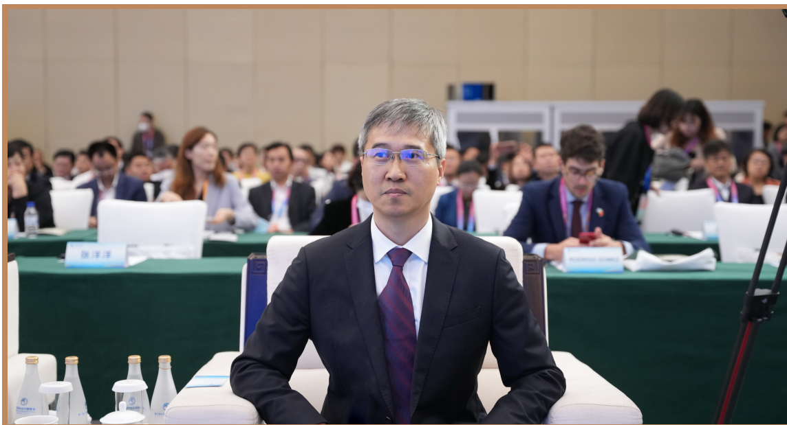
商务部自贸区港建设协调司司长杨正伟 在上海出席“投资中国年”自贸试验区专场投资促进活动并主持致辞、主旨发言及成果发布环节