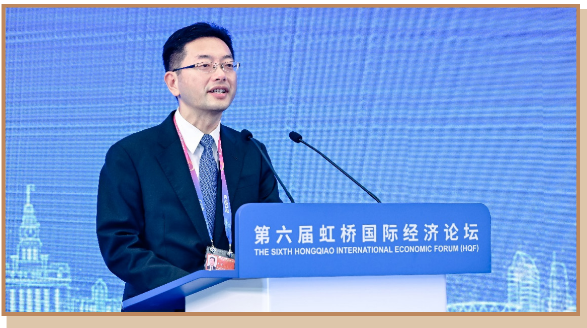
浦东新区区委常委、常务副区长杨朝 在上海出席“打造引领区卓越营商环境 推动浦东高水平对外开放”分论坛并主持推介环节