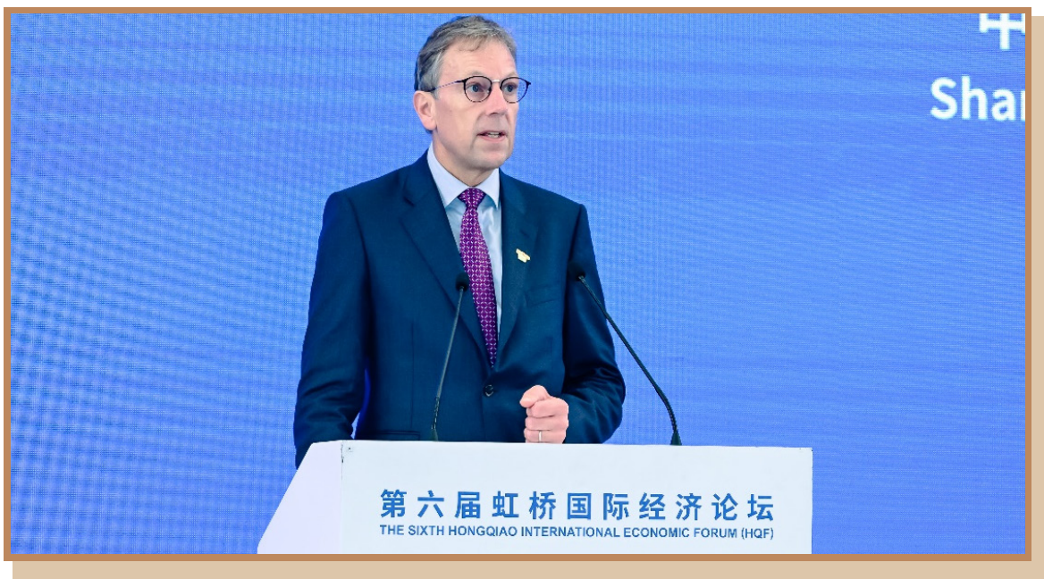
力拓集团全球首席执行官石道成 在上海出席“打造引领区卓越营商环境 推动浦东高水平对外开放”分论坛并作主旨演讲

力拓集团全球首席执行官石道成表示，力拓的发展离不开中国伙伴的合作与创新。浦东是设立港口现货贸易这一新业务的最佳地点，完美地结合了金融、贸易、航运和创新等方面的优势。通过积极合作，引领错币种交易模式创新，力拓的业务也被认定为这一模式的试点。力拓成为中国首家在大宗商品交易中使用增值税电子发票的公司，并且被认定为十家创新样本企业之一，港口现货贸易业务有助于开放更多国际贸易，将价值链从西澳延伸到中国乃至全球。正是创新和互利合作推动了成功的合作伙伴关系。