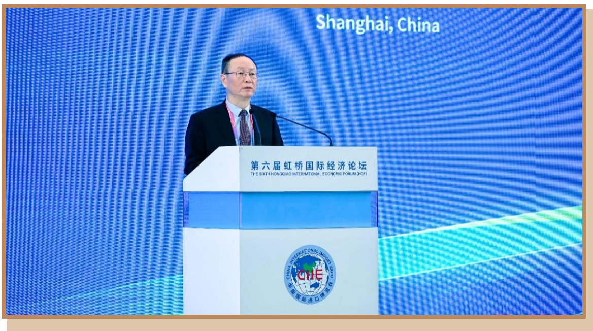
中国国际经济交流中心副理事长王一鸣 在上海出席“打造引领区卓越营商环境 推动浦东高水平对外开放”分论坛并作主旨演讲

中国国际经济交流中心副理事长王一鸣表示，对外开放离不开营商环境，高水平开放要求建设更加卓越的营商环境。浦东在新起点上打造社会主义现代化建设引领区，就要聚焦全球资源配置功能、科技创新策源功能、高端产业引领功能、开放枢纽门户功能，提升营商环境市场化、法治化、国际化水平，为高效畅通国内国际双循环，加快构建新发展格局发挥引领作用。打造卓越营商环境，必须深化外商投资管理体制改革、推进对外贸易创新发展、深化金融领域开放改革、深化科技创新的开放合作。