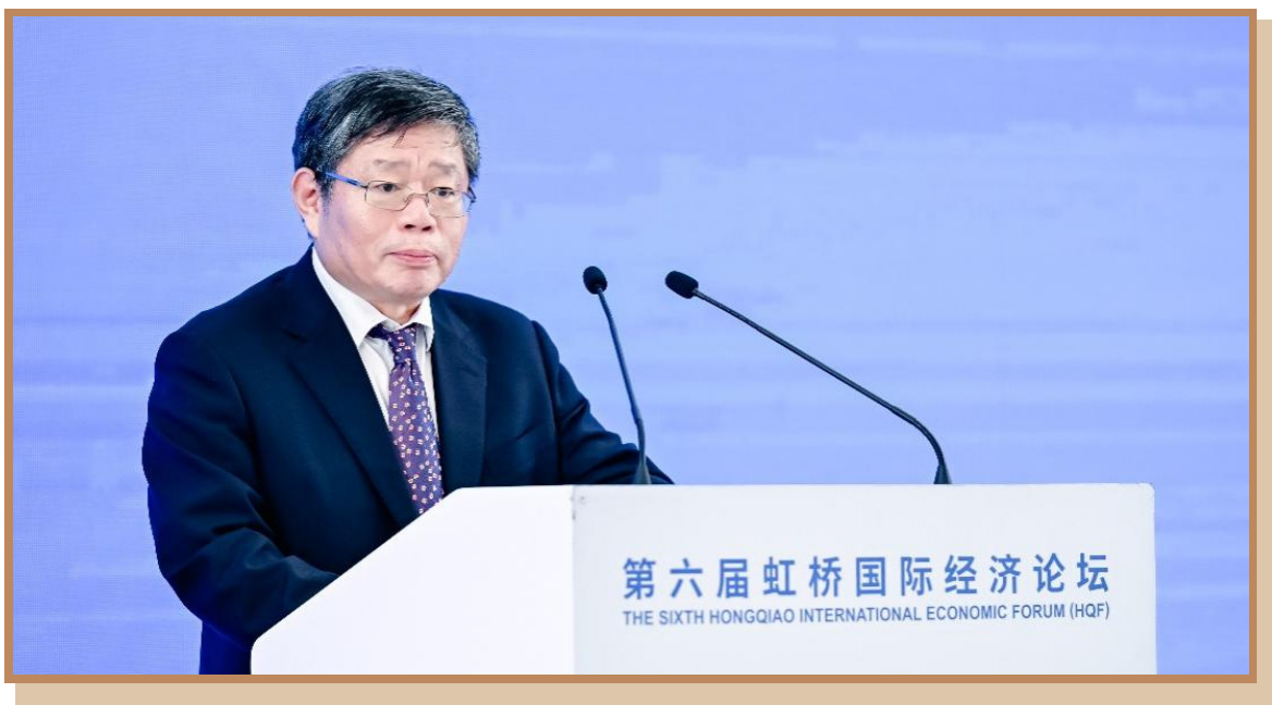
国家发展和改革委员会党组成员郭兰峰 在上海出席“打造引领区卓越营商环境 推动浦东高水平对外开放”分论坛并致辞

国家发展和改革委员会党组成员郭兰峰指出，推动浦东高水平对外开放，要坚持走解放思想深化改革之路，走面向世界扩大开放之路，走打破常规创新突破之路，打造国际一流营商环境。第一，加强改革举措系统支撑。协同高效，扎实开展综合改革试点；第二，打造制度性开放示范窗口，积极主动地与国际高标准经贸规则衔接对接；第三，推动科技自立自强，优化科技创新管理机制和资源配置；第四，深入探索超大城市治理路径，推动城市治理模式创新、治理方式重塑、治理体系重构。