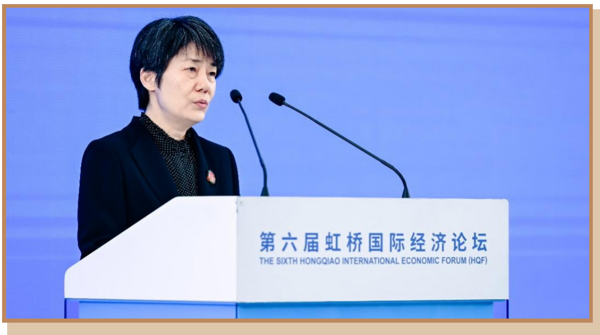
商务部党组成员、副部长郭婷婷 在上海出席“打造引领区卓越营商环境 推动浦东高水平对外开放”分论坛并致辞

商务部党组成员、副部长郭婷婷指出，近年来浦东勇当高水平改革开放的开路先锋、自主创新发展的新时代标杆、全球资源配置的功能高地、扩大国内需求的典范引领、现代城市治理的示范样板，取得了明显成效。未来商务部将进一步深入贯彻落实党中央国务院关于支持浦东新区高水平改革开放的部署要求，和各方一道在先行先试扩大市场准入，着力推动投资中国、投资浦东，持之以恒推进制度型开放等方面支持浦东持续推进更大范围、更宽领域、更深层次的对外开放。