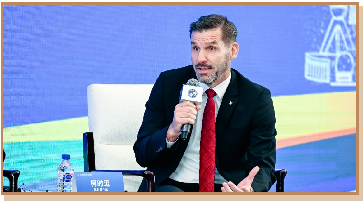
保时捷中国区总裁柯时迈