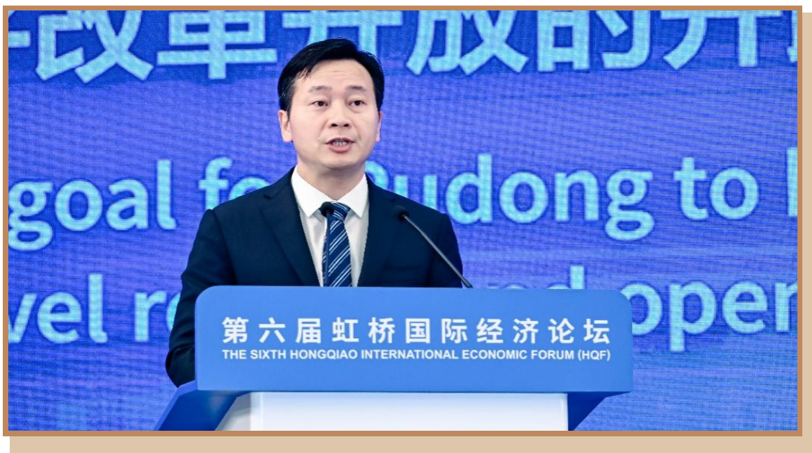
上海市人民政府副秘书长、浦东新区区委副书记、代理区长吴金城 在上海出席“打造引领区卓越营商环境 推动浦东高水平对外开放”分论坛并参与推介环节

上海市人民政府副秘书长、浦东新区区委副书记、代理区长吴金城表示，浦东作为上海国际经济、金融、贸易、航运、科技创新“五个国际中心”建设的核心区，将进一步聚焦强化“四大功能”，不断提升城市能级和核心竞争力。主要有以下两方面举措：一是聚焦实施“6G”计划，二是大力拓展空间载体。当前，浦东深入实施自贸试验区提升战略、启动建设“丝路电商”合作先行区、积极推进浦东综合改革试点、全力打造营商环境示范样板。下阶段，浦东将进一步鼓励创新、保护创新，成为高水平改革开放的试验田。