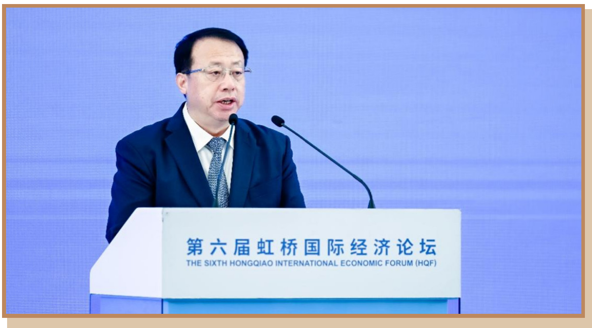
上海市委副书记、市长龚正