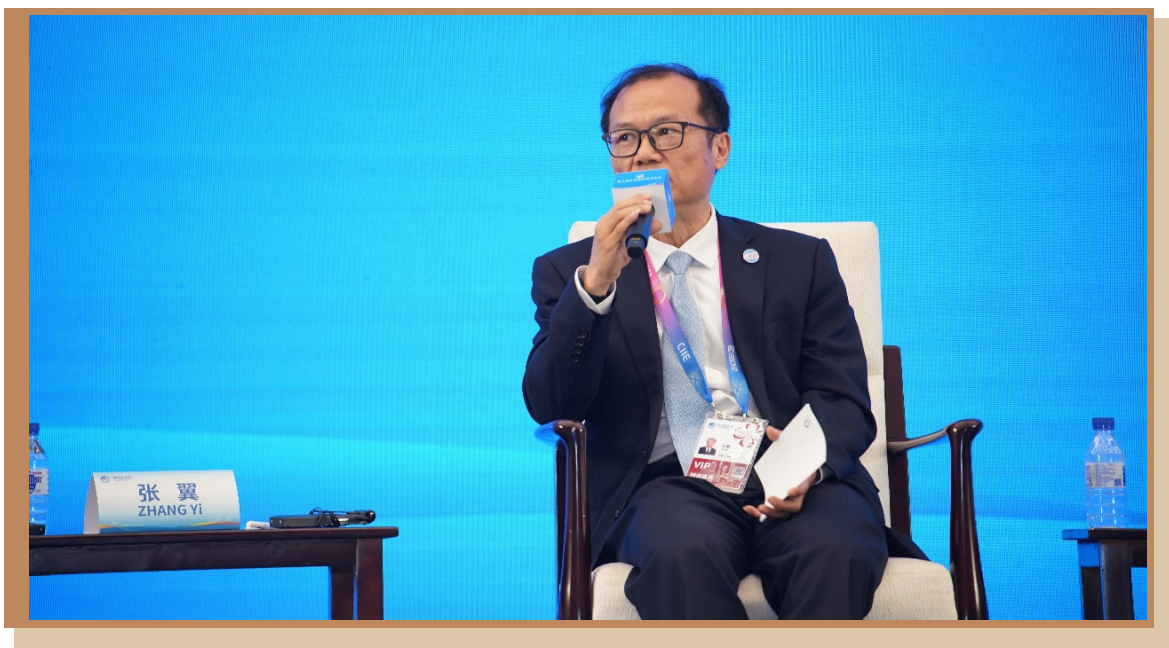
中国国际经济技术交流中心副主任张翼 在上海出席“面向现代化的工业园区创新提升之路—南南合作可持续发展的新突破”分论坛并参与讨论

中国国际经济技术交流中心副主任张翼表示，中国与联合国相关机构开展工业园区合作，为其他发展中国家提供技术转移、能力建设、人才培养等支持的同时，也广泛与其他各方推动南南合作。未来，工业园区建设要注重“合作”“创新”“开放”三个关键词。一是在经济协调中推动可持续发展，实现南南合作与三方合作的突破。二是创新驱动，因地制宜找准突破点。三是保持开放、合作、互利、共赢态度，共同推动 2030 年可持续发展议程、构建人类命运共同体。