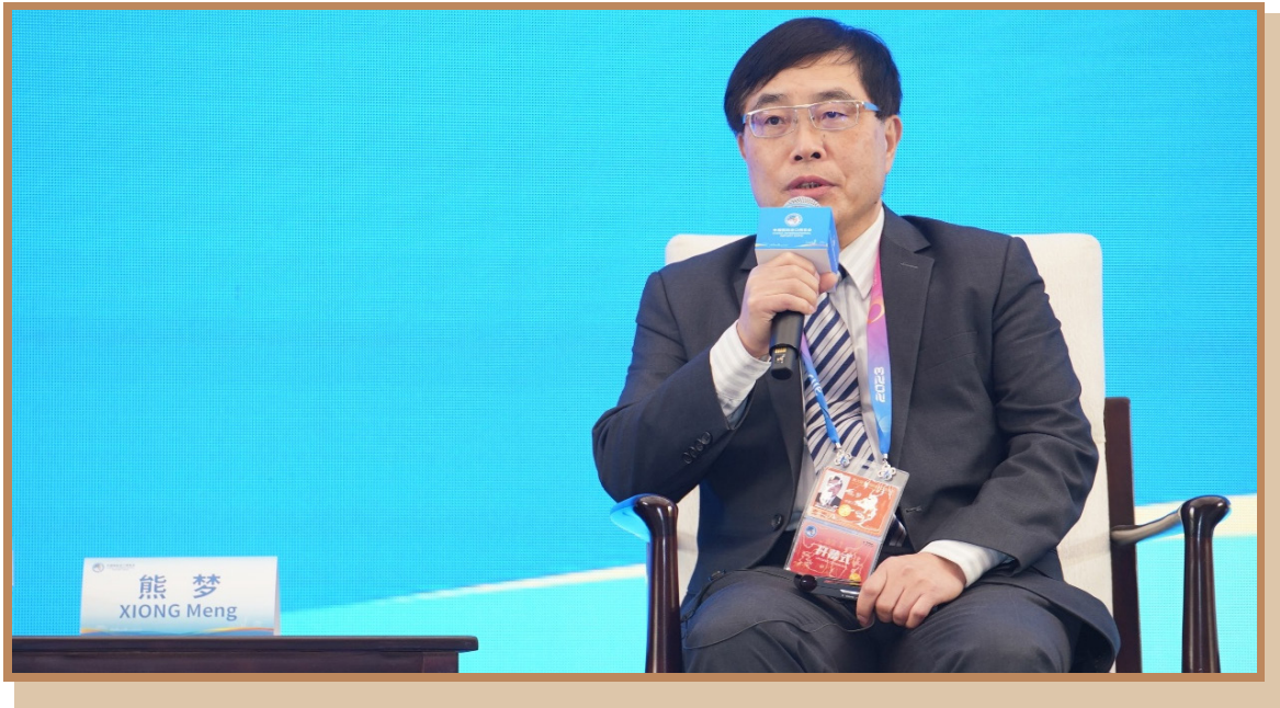
中国工业经济联合会执行副会长兼秘书长熊梦 在上海出席“面向现代化的工业园区创新提升之路—南南合作可持续发展的新突破”分论坛并参与讨论

中国工业经济联合会执行副会长兼秘书长熊梦表示，习近平主席提出的“创新链、产业链、资金链、人才链”四链深度融合，是工业园区建设应遵循的基本逻辑。创新工业园区建设要按照产业发展规律与需求，针对产业链的难点、痛点、堵点、卡点，找到创新驱动动力，实现产业链上中下游融通发展；以问题导向牵引来立项、聚人才、聚资金，并与产业链深度融合；资金链应与其他链的需求适配；人才链应兼顾高端人才与高阶段人才，破除产业发展困境。