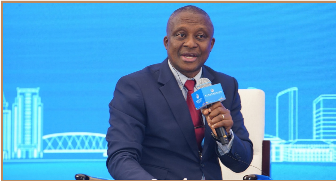
联合国工业发展组织区域首席代表（中国，朝鲜，蒙古）康博思 在上海出席“面向现代化的工业园区创新提升之路—南南合作可持续发展的新突破”分论坛 并主持讨论环节主题二